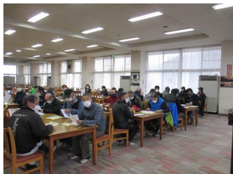
従業員打合せ会議にて安全教育を実施