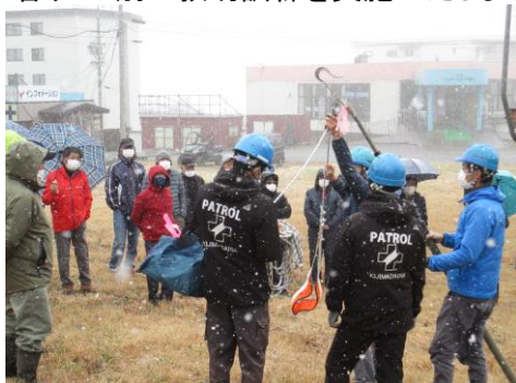
パトロール隊による救助用具の説明